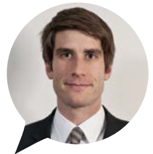
Strategy Adviser SUNSTAR

einen ganz klaren gesellschaftlichen Handlungsauftrag, der sich durch die Ideen und das Engagement der Treiber aus dem Healthcare-Markt realisieren lässt. Verwirklichen ließen sich solche Ideen schließlich durch die gebündelte Kompetenz junger Entscheidungsträger, die sich bei YEH zusammenfinden und konzentriert Dinge vorantreiben. „ Der gemeinsame Austausch steht für mich im Vordergrund. Durch diese wertvollen Verbindungen können Bewegungen entstehen, die auch der Branche gut tun werden. “