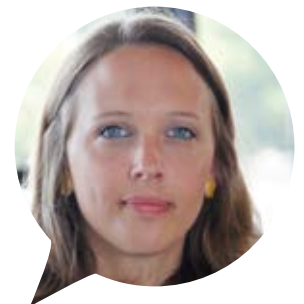
Etatsdirektorin WEFRA WERBEAGENTUR

nach dem nächsten Schritt auf der Karriereleiter stehen da ebenso im Zentrum wie die jeweiligen individuellen Herausforderungen, denen sich junge Führungskräfte gegenüber sehen.“ Hier seien die Coachings, die im Rahmen der regelmäßigen Treffen angeboten werden, essentiell. „Wir profitieren gegenseitig von unseren Erfahrungen und das nicht nur auf der inhaltlichen Ebene, sondern vor allem bei der persönlichen Entwicklung.“