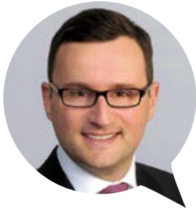
Counsel C'M/S' Hasche Sigle