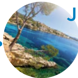
Mallorca Herbst 2014