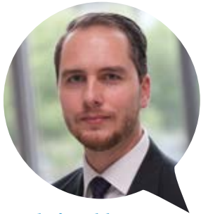
Head of Healthcare Management ARVATO HEALTHCARE

Bei Young Excellence in Healthcare geht es nicht nur ums Netzwerken, warum Young Potentials YE(H)S sagen sollten, erklären die Mitglieder: